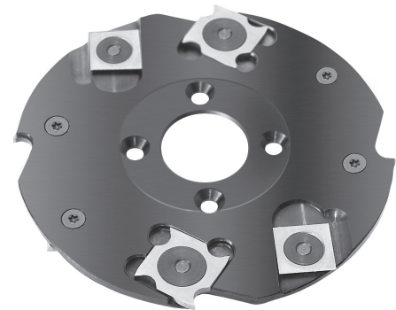
Grundkörper Stahl Tool body in steel Corps de base en acier